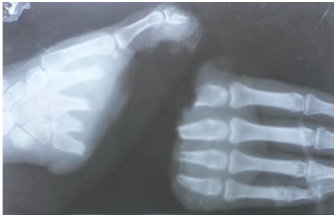
Figura: Raio X de uma mão cortada por uma serra circular.